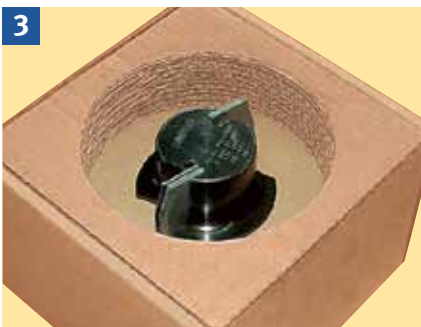
Werkzeuge mit Hartmetallwechschelschneiden immer in der Originalverpackung transportieren.