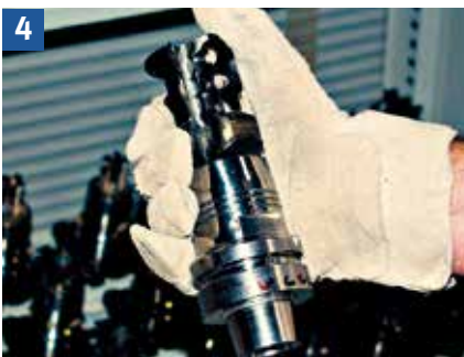
Beim Ein- und Ausbauen von Werkzeugen mit Hartmetallwechschelschneiden die Hände mit Handschuhen oder einem Lappen schützen.

Folge: abfliegende Schneideteile nach Haarrissbildung!