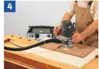
Handvorschub = Arbeiten mit Handmaschinen