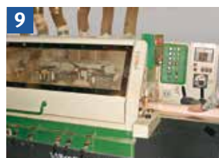
Mechanischer Vorschub = z. B. Arbeiten mit Mehrseiten-Hobel- und Fräsmaschine