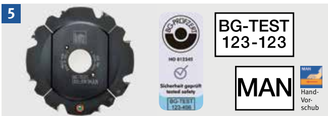
Kennzeichnung eines Fräswerkzeugs für Handvorschub