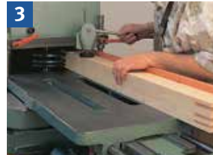
Handvorschub = Arbeiten mit dem Schiebeshlitten