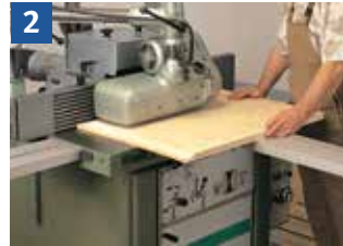
Handvorschub = Arbeiten mit dem Vorschubapparat