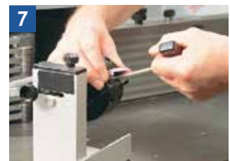
Lösen der Spannschrauben mit vorgegebenem Werkzeug (Imbusschlüssel)