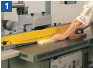
Handvorschub = Halten und Führen der Werkstücke von Hand