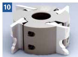
Kennzeichnung eines Fräswerkzeugs für Mechanischen Vorschub