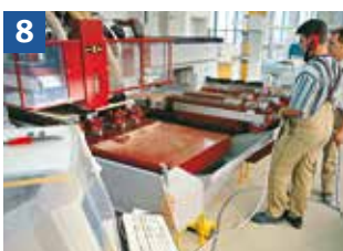
Mechanischer Vorschub = z. B. Arbeiten mit CNC-Bearbeitungszentrum