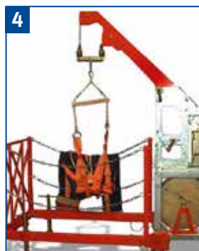
Einfahren mit Siloeinfahrvorrichtung.