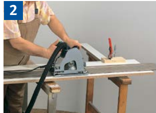
2 Sägen von Plattenmaterial mit Führungsschiene.