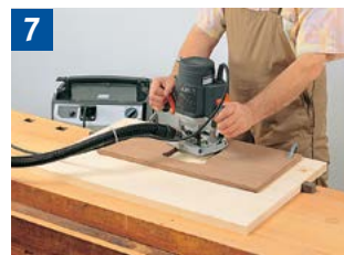
7 Einsatz der Handoberfräsmaschine mit Schablone.