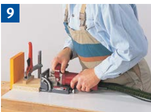
9 Einfräsen von Nuten, kleine Werkstücke festspannen.