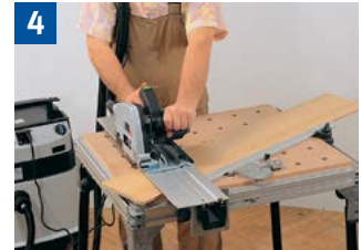
4 Bei Montageschnitten für sichere Werkstückauflage und präzise Werkzeugführung sorgen.