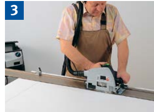
3 Einsetsägen mit Tauchkreissäge und Führungsschiene mit Anschlagnocken (als Rückschlagsicherung).