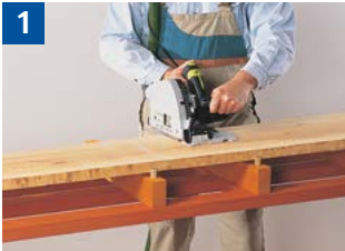
1 Sägen von Massivholz auf Unterlagen mit Anschlagknoppen.