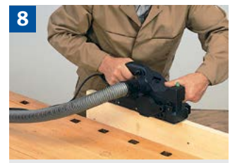
8 Hobeln von Flächen.