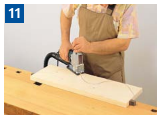
11 Sägen geschweiften Werkstücke.