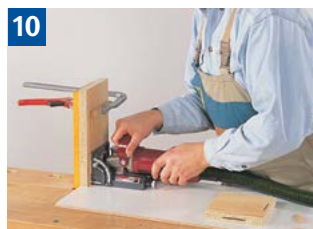
10 Einfräsen von Nuten mit Stützwinkel.