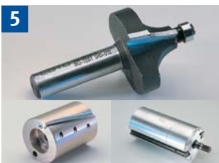
5 Werkzeuge für Handmaschinen müssen für Handvorschub zugelassen sein.