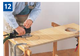
12 Sägen von Ausschnitten.