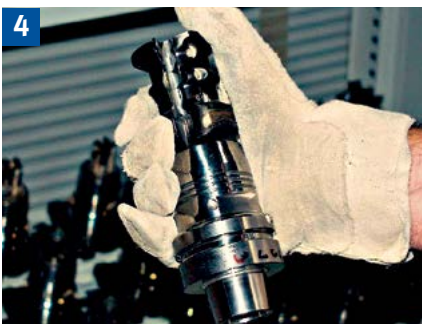
Beim Ein- und Ausbauen von Werkzeugen mit Hartmetallwechschelschneiden die Hände mit Handschuhen oder einem Lappen schützen.

Folge: abfliegende Schneideteile nach Haarrissbildung!