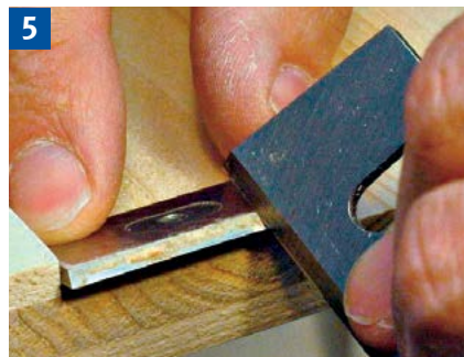
Achtung! Wendeplatten, Plattensitz und Spannkeil von Ablagerungen säubern, z. B. Harz- und Holzstaubablagerungen abschaben.