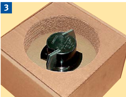
Werkzeuge mit Hartmetallwechschelschneiden immer in der Originalverpackung transportieren.