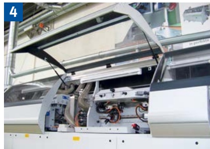
Werden die Gefahrstellen der Werkzeugaggregate z. B. mit elektrisch verriegelten Schutzhauben (gegebenfalls mit Zuhaltung) gesichert?