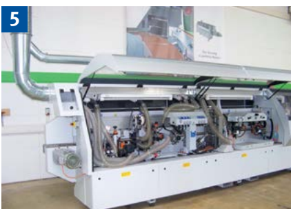
Werden Späne aus dem Bereich der Ziehlinge z. B. abgesaugt oder mit einem Spänehooken entfernt?