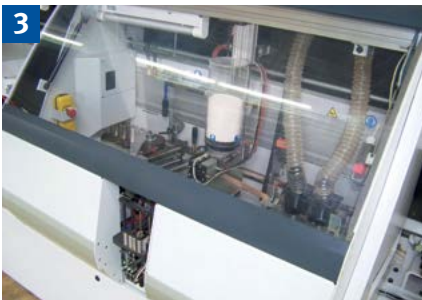
Sind die Gefahrstellen der Stachelwalze gesichert, z.B. mit einer elektrisch verriegelten Schutzhaube oder durch eine fest verschraubte Verkleidung?