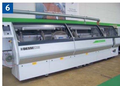
Werden die Werkzeugaggregate mit elektrisch verriegelten Schutzhauben – gegebenenfalls ergänzt mit einer Zuhaltfunktion – gegen Erreichen gesichert?