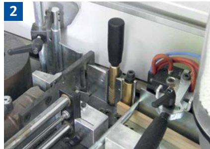
Gefahrstellen der Stachelwalze