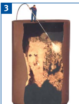
Beseitigen von Fließstörungen im Silo nach Möglichkeit von außerhalb beseitigen, nur im Notfall einfahren.