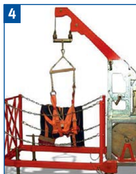
Einfahren mit Siloeinfahrvorrichtung.