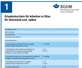
Nur mit schriftlicher Erlaubnis in Silos einfahren.