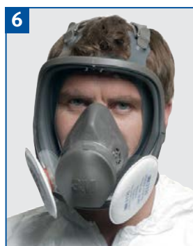
Vollmaske mit Partikelfilter P2