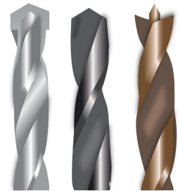
Abb. 2: Stein-, Metall-, Holzbohrer

Sowohl bei der Handbohrmaschine als auch beim Bohrer gibt es Vielzweck- und Spezialversionen. Wählen Sie die für ihre Arbeit geeignete Maschine und einen für das Material und den Maschinentyp passenden Bohrer aus (siehe Abb. 2).