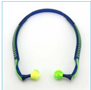
Abb. 4 Bügelstöpsel