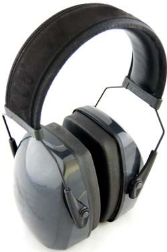
Abb. 1 Kapselgehörschützer