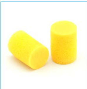
Abb. 3 Gehörschutzstöpsel

Eine Besonderheit sind Bügelstöpsel, welche sich besonders leicht auf- und absetzen lassen und deshalb für häufiges kurzzeitiges Betreten von Lärmbereichen geeignet sind. Ihre Schutzwirkung ist jedoch geringer.