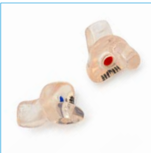
Abb. 5 Gehörschutz-Otoplastik

Ein sicherer Schutz wird nur erreicht, wenn die Gehörschutz-Otoplastik nach der Auslieferung und danach in regelmäßigen Abständen von maximal drei Jahren überprüft wird. Lassen Sie sich das richtige Einsetzen z.B. vom Hersteller oder Lieferanten der Gehörschutz-Otoplastik oder Ihrem Betriebsarzt zeigen.