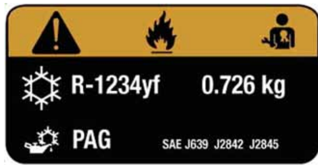
Beispiel Hinweisschild in einem Kfz mit R1234yf