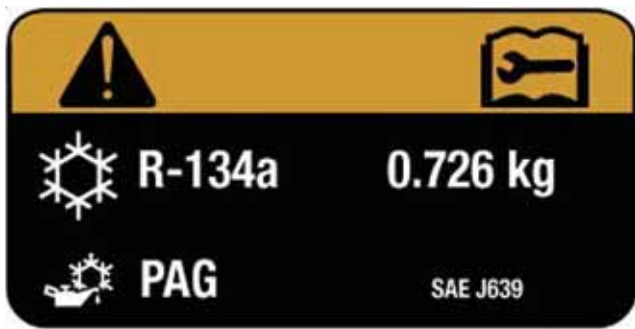
Beispiel Hinweisschild in einem Kfz mit R134a