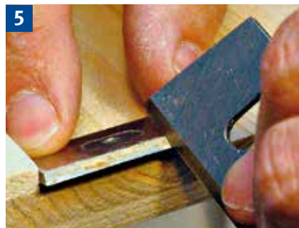
Achtung! Wendeplatten, Plattensitz und Spannkeil von Ablagerungen säubern, z. B. Harz- und Holzstaubablagerungen abschaben.