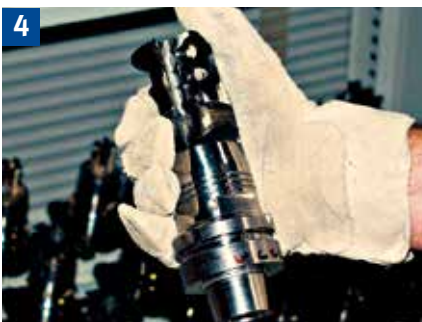
Beim Ein- und Ausbauen von Werkzeugen mit Hartmetallwechscheln die Hände mit Handschuhen oder einem Lappen schützen.

Folge: abfliegende Schneideteile nach Haarrissbildung!