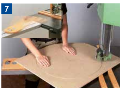
Vorrichtung und Handhaltung beim Herstellen kreisförmiger Werkstücke