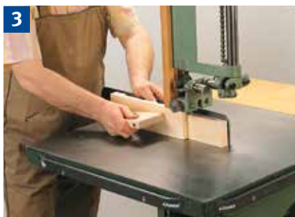
Auftrennen am Anschlag mit Zuführlade