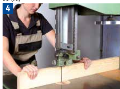
Quersägen von hochkant stehenden Werkstücken mit Anlage am Maschinenständer