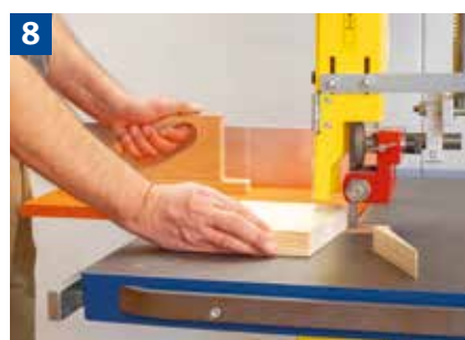
Sägen von Keilen mit Keilschneidlade