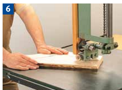
Handhaltung beim Herstellen geschweiften Werkstückes