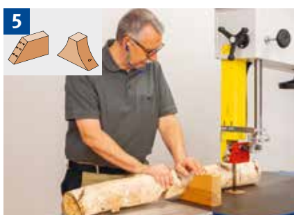
Quersägen von Rundholz mit Keilstütze