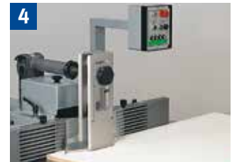
4 Fräsen von breiten Werkstücken am Anschlag mit Druck- und Schutzvorrichtung