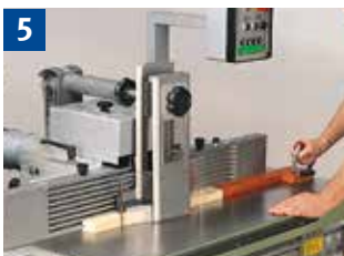
5 Fräsen von kleinen Werkstücken am Anschlag mit Druck- und Schutzvorrichtung und Schiebehölz