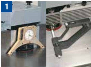
1 Einstellen von Fräshöhe und Frästiefe mit Messuhr