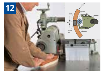
12 Fräsen von geschweiften Werkstücken mit Anlaufing, Bogenfräshaube und Vorschubapparat (nur 1 Rolle)