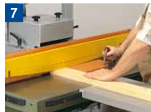
7 Fräsen von Querseiten mit durchgehendem Anschlag, Bogenfeder und Schiebehölz