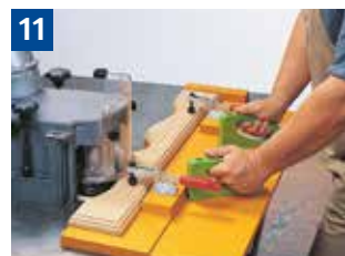
11 Fräsen von geschweiften Werkstücken mit Anlaufing und Bogenfräshaube