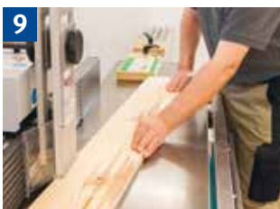
9 Einsetzfräsen großer Werkstücke mit Rückschlagsicherung