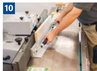
10 Einsetzfräsen kleiner Werkstücke mit Spannrolle und Rückschlagsicherung