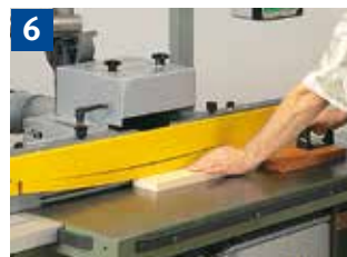
6 Fräsen von kleinen Werkstücken am Anschlag mit Bogenfeder und Schiebehölz