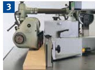
3 Fräsen von geraden Werkstücken am Anschlag mit Vorschubapparat