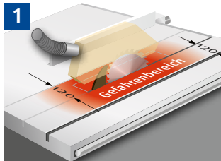
1 Eingreifen in den Gefahrenbereich nur mit Hilfsmittel