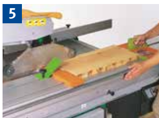
5 Vorrichtung und Handhaltung beim Besäumen