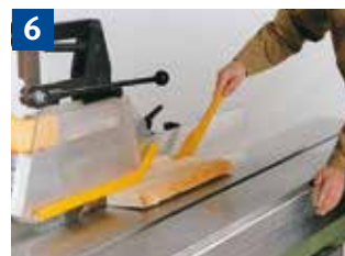
6 Sägen schmalen Werkstücke mit Schiebstock