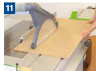
11 Schutzvorrichtungen und Handhaltung beim Einsetzen sägen. Sägeblatt wird von unten nach oben durch das Werkstück angehoben.