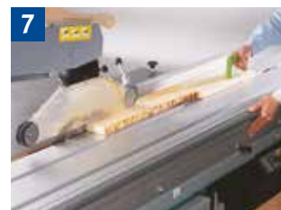
7 Sägen von Leisten mit Schiebholz