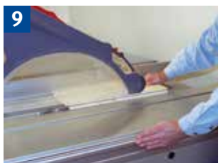
9 Schutzvorrichtung und Handhaltung beim Fälen