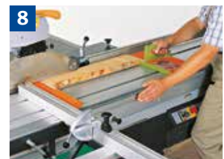
8 Sägen von Leisten mit vorderer und hinterer Sägehilfe