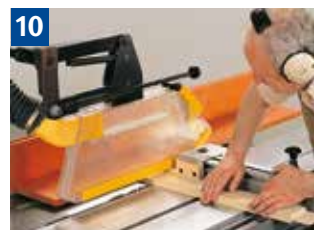
10 Schutzvorrichtung und Handhaltung beim Absetzen von Zapfen