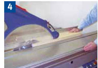
4 Längssägen von Breite mit der Hand (Breite über 120 mm)