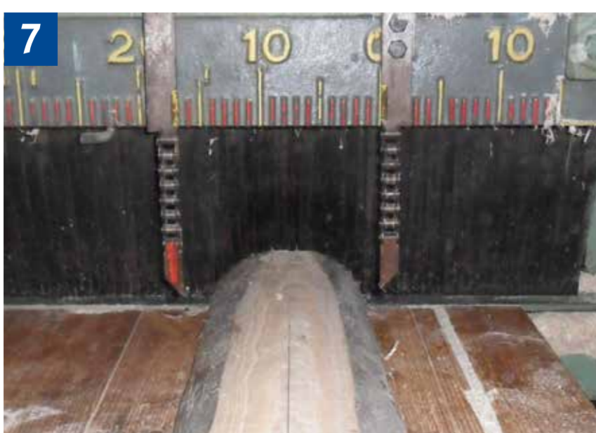
7 Eine leichtgängige Rückschlagsicherung umschließt das Werkstück lückenlos und verhindert das Heraus-schleudern von Splintern.