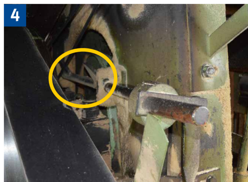
4 Formschlüssige Sicherung gegen Herabsinken des Sägerahmens