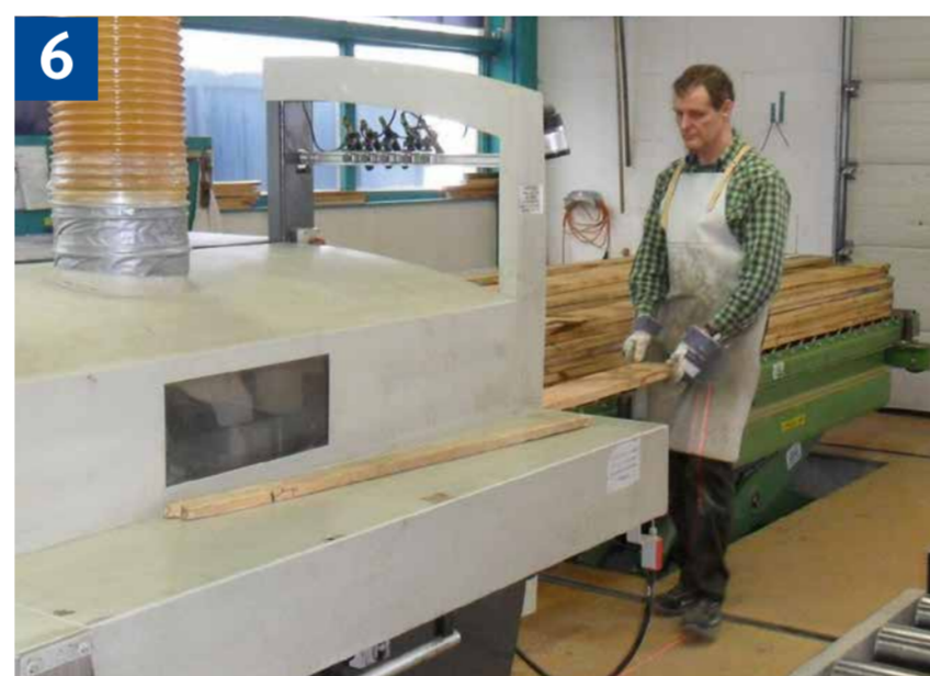
6 Beim Aufgeben an der Mehrblattsäge Schürze als Rumpfschutz tragen.