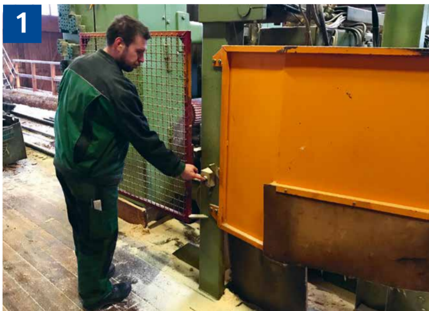
1 Trennende Schutzeinrichtungen mit Verriegelungseinrichtung