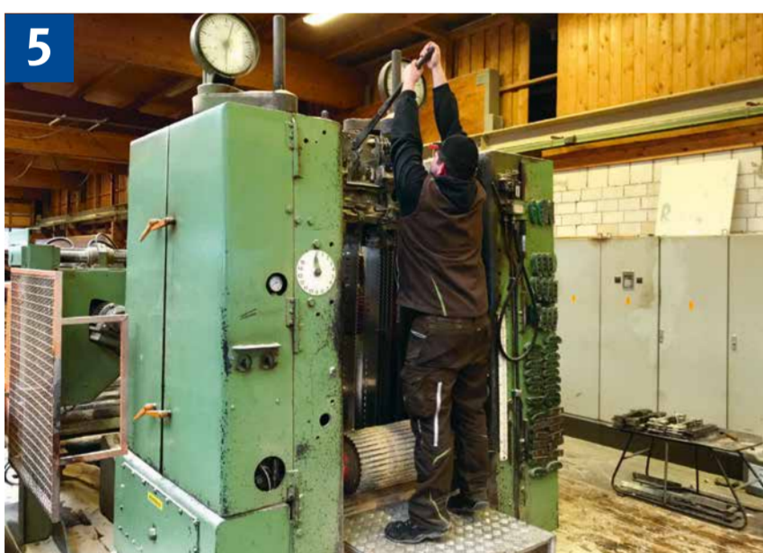
5 Spannen der Sägeblätter von geeigneter Standfläche aus