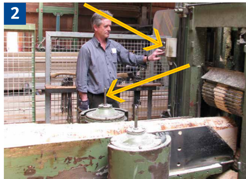
2 Störungsbeseitigung am Spaltkeil, Auszugswalzen mit Griff