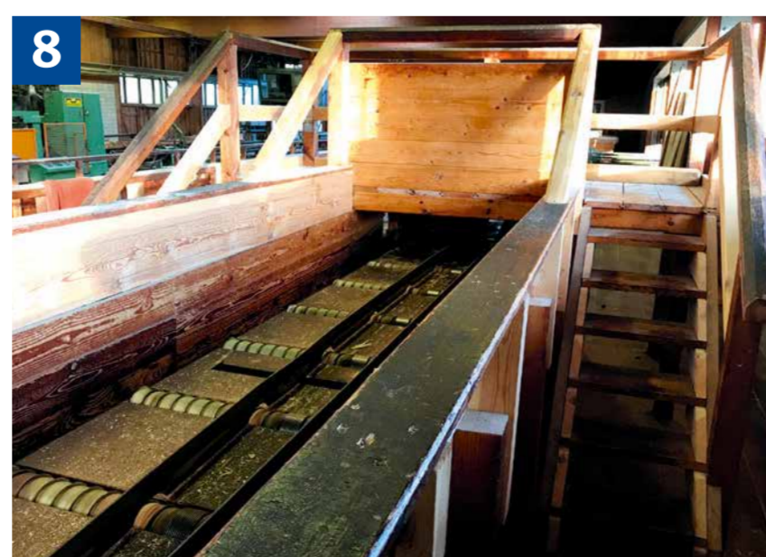
8 Fördereinrichtung mit sicherem Übergang