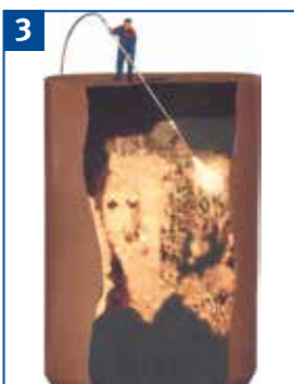
Fließstörungen im Silo nach Möglichkeit von außerhalb beseitigen, nur im Notfall einfahren.