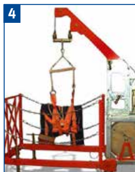
Einfahren mit Siloeinfahrvorrichtung.