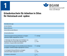
Nur mit schriftlicher Erlaubnis in Silos einfahren.