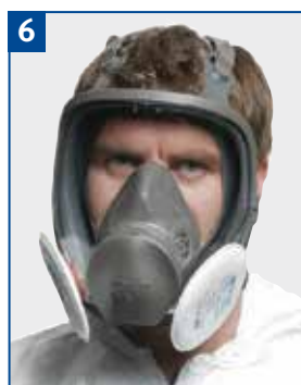
Vollmaske mit Partikelfilter P2